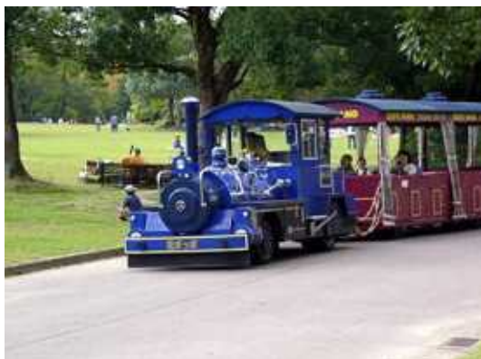
パークトレイン・エコバスの運行ルート